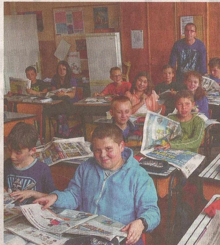
R.D. Une source d'exercices inépuisable pour les élèves du Mont-à-Leux. ■ R.D.

Et même dans les publicités, qui pourraient sembler peu intéressantes pour les élèves, Monsieur Rodrigue trouve une utilité. « Les pubs sont d'excellents exemples de textes argumentatifs. Je le répète, chaque journal offre une multitude de sources de travail », sourit l'instituteur. ■